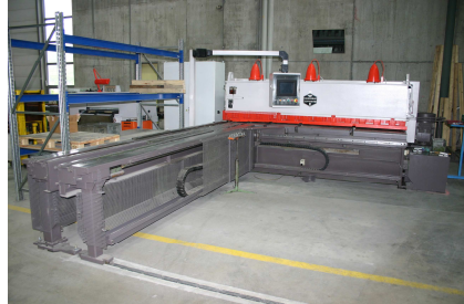
Hämmerle AS 3100x8